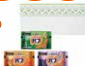
入浴剤（バブ3錠箱入）